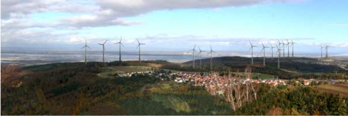
Abb: 1, Freiolsheim , Nordschwarzwald, Vorbergzone mit montierten WKA in ausgewiesenen Suchgebieten.